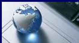
Mind Open Source Project